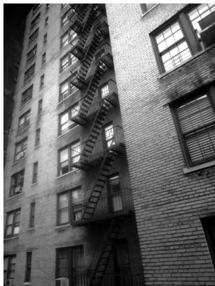
Photo de la lettre Z