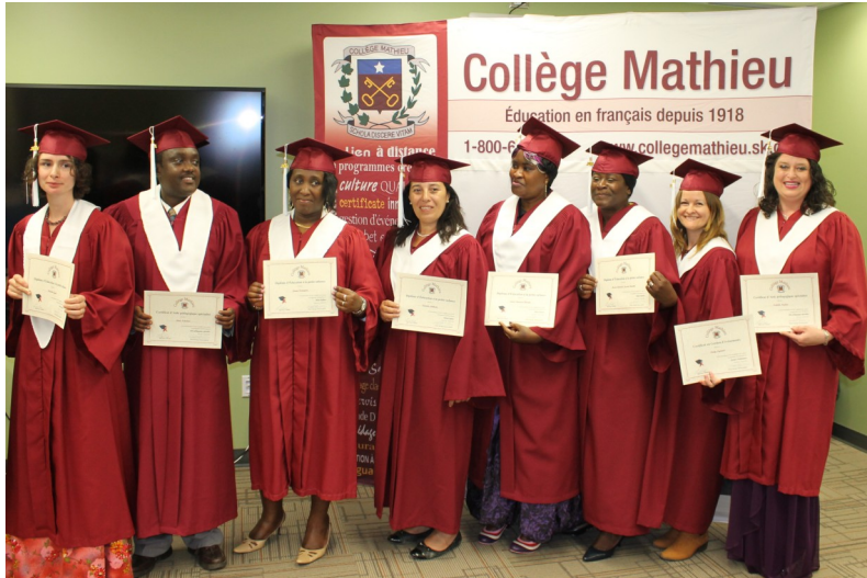
Huit finissants des onze qui ont pu assister à la cérémonie à Regina

À côté de leurs familles, amis et connaissances, les finissants de l'année académique 2013-2014 étaient fiers de leurs parcours et accomplissements en recevant leurs diplômes et certificats le 28 juin dernier à Regina.