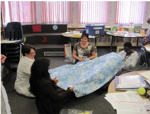
Les participantes à la formation du 18 octobre à Saskatoon

Une journée de formation a été organisée à Saskatoon le samedi 18 octobre dernier afin d'outiller les animatrices des groupes de jeux en régions et aux Centres d'appui à la famille et à l'enfance (CAFE) partout en province. La formation a été un grand succès avec une participation de dix communautés, animée par: