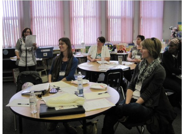
Les participantes à la formation du 18 octobre à Saskatoon