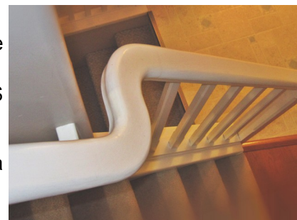
Photo de la lettre S