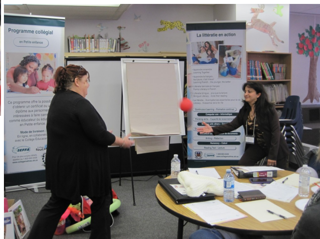
Les participantes à la formation du 18 octobre à Saskatoon

Ces groupes de jeux sont gratuits et s'adressent aux familles ayant des enfants âgés de 0 à 6 ans. Toutes les semaines, des parents et des enfants se rencontrent pour parler et jouer en français. C'est une promotion de la littératie, l'activité physique et l'alimentation saine, dans un cadre informel et chaleureux.