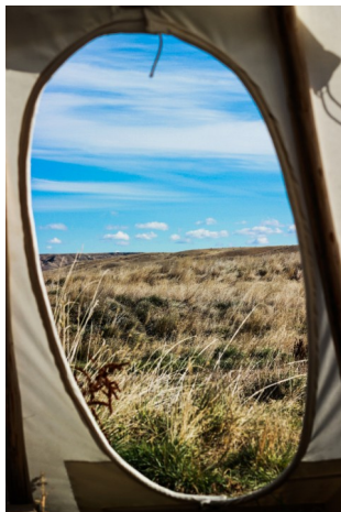
Photo de la lettre O