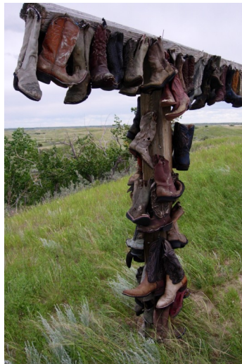
Photo de la lettre T