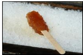
Tire sur la neige