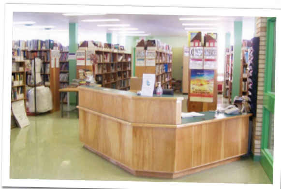
Centre de ressources culturelles et pédagogiques, le Lien.

Le Res-O-Lien, service de dépôts de ressources dans les communautés, a accru l'envoi et le renouvellement des commandes de ressources dans les communautés qui l'utilisent.